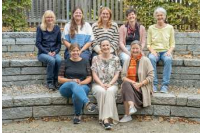
Abb. 4: Team Montessori Kinderhaus Inning (unvollständig)

Im Kinderhaus arbeiten Pädagoginnen und Pädagogen mit Ausbildung in der Montessori-Pädagogik, vorzugsweise mit dem Diplom der „Association Montessori International“ (AMI). AMI wurde 1929 von Maria Montessori gegründet.