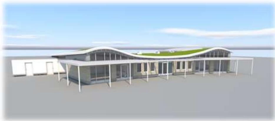
Abbildung 3: Neubau Kinderhaus mit Blick Richtung Westen

Im Jahr 2013 wurde das Kinderhaus im Schulgebäude für 22 Kinder eröffnet und im März 2022 mit einer zweiten Gruppe im neuen Kinderhausgebäude für insgesamt 50 Kinder erweitert.