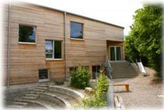
Abbildung 1: Schule

Heute betreut der Förderverein Montessori Ammersee e.V. ca. 290 Kinder im Alter von 3 bis 16 Jahren. Die Schule ist im alten Inninger Schulhaus und im 2011 fertiggestellten Neubau untergebracht. Das Kinderhaus befindet sich seit 2022 im eigenen Neubau.