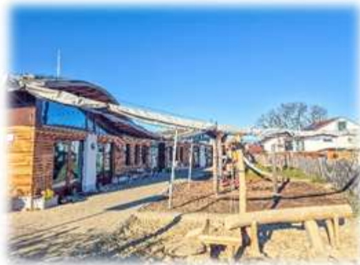
Abbildung 2: Kinderhaus